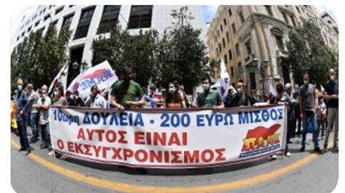
Από τις περσινές κινητοποιήσεις ενάντια στο νομοσχέδιο της 10ωρης δουλειάς

μείωση του ωραρίου, ώστε κάθε ώρα που δουλεύει ο εργαζόμενος να αποφέρει τα μέγιστα κέρδη στον εργοδότη και να «κοστίζει» λιγότερο, σε όλες τις περιόδους, είτε αυξημένης είτε μειωμένης απασχόλησης, ανάλογα με τις ανάγκες της επιχείρησης. Όσο για την ανυπομονησία που καλλιεργούν τα διάφορα ρεπορτάζ για να τρέξει και στην Ελλάδα το μέτρο δεν είναι τίποτε άλλο από την προπαγάνδα, ώστε να μετριάσει η καθολική απόρριψη του νόμου - έκτρωμα για τα Εργασιακά, που ψηφίστηκε πέρσις τέτοιες μέρες και περιλαμβάνει και τη «διευθέτηση», όπως αυτή περιγράφεται σε σχετικές ευρωενωσιακές Οδηγίες.